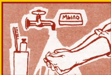
Регулярно мойте руки