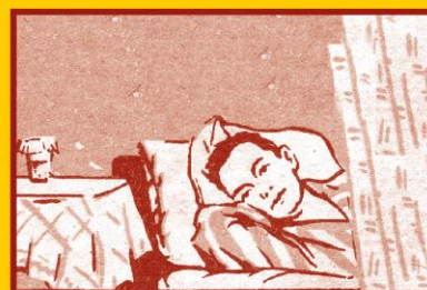
Избегайте контактов с заболевшими