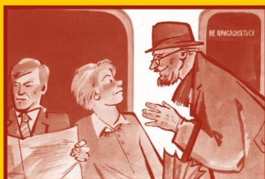
Ограничьте пребывание в местах скопления людей