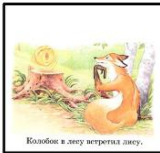
Колобок в лесу петрогил лису.