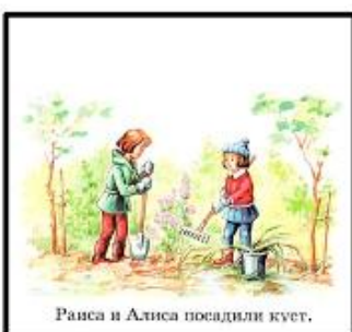
Раиса и Алиса посадили куст.