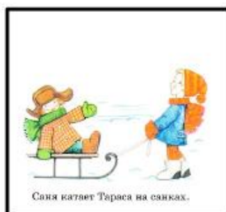
Саня катает Тараса на санках.