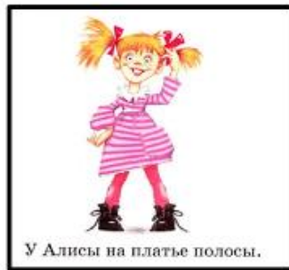
У Алисы на платье полосы.