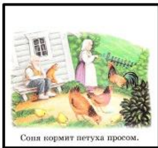
Соня кормит петуха просом.