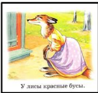
У лисы красные бусы.