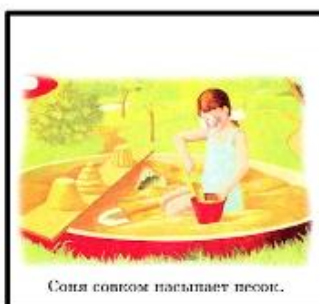
Соня совком насыпает песок.