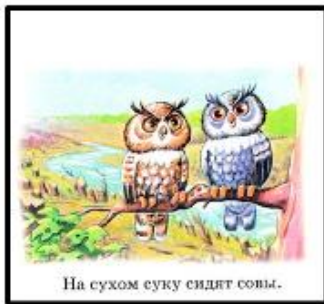
На сухом суку сидят совы.